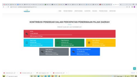
Gambar 3. Pengumuman Nilai Pajak Daerah Kota Pangkalpinang Periode Desember 2021.

Tanggung jawab pemerintah dalam hal ini Pemerintah Kota Pangkalpinang dapat dilihat dari keterbukaan informasi terkait penerimaan pajak. Berikut ini adalah gambar mengenai isi aplikasi PENDEKAR yang bisa diakses oleh masyarakat. Berikut contoh implementasi akuntabilitas publik di Pemerintah Kota Pangkalpinang.