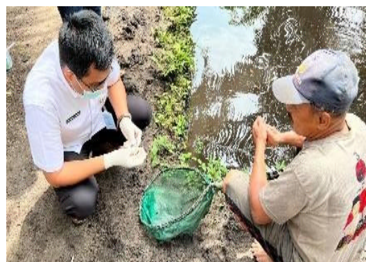
Gambar 1. Kegiatan Monitoring dan Surveilans.

Kegiatan monitoring dan surveilans juga merupakan cara untuk pengembangan inovasi Bang Kophit (Fachri, 2021).